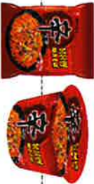
辛ラーメン焼きそば