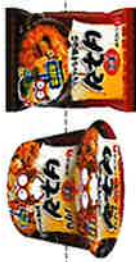
旨辛焼きちゃんぽん (※カットは受注生産品)