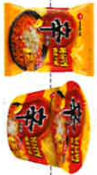
辛ラーメン焼きそば チーズ