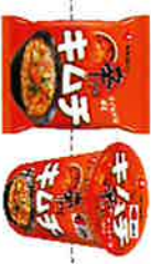
辛ラーメンキムチ